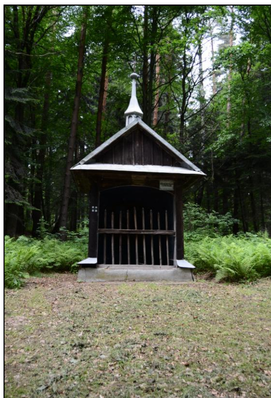
Fot. 4. Kaplica Pożegnanie Maryi z Apostołami. Photo 4. Chapel of farewell to Mary with the Apostels.