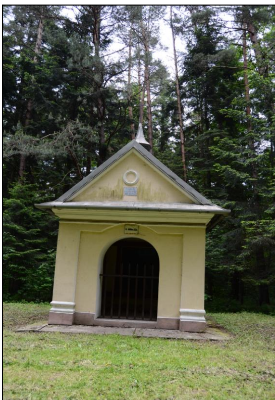
Fot. 3. Kaplica u Annasza. Photo 3. Chapel of Annasz.