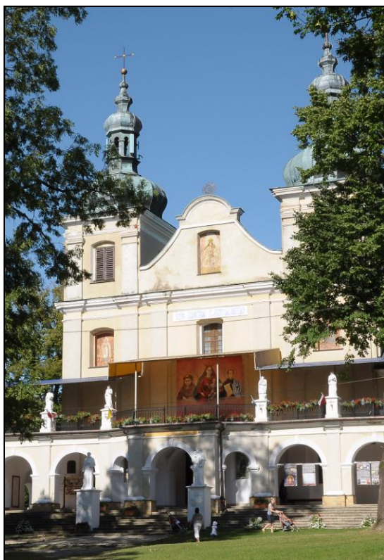
Fot. 1. Kościół w Kalwarii Paclawskiej. Photo 1. Church in Kalwaria Paclawska.